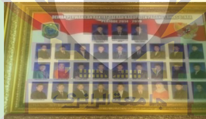
Gambar 4.1 Susunan Anggota Legislatif Periode 2014-2019