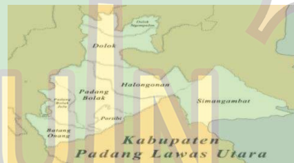
Gambar 1.1 Peta Padang Lawas Utara

Berikut ditampilkan peta administrasi Kabupaten Padang Lawas Utara.