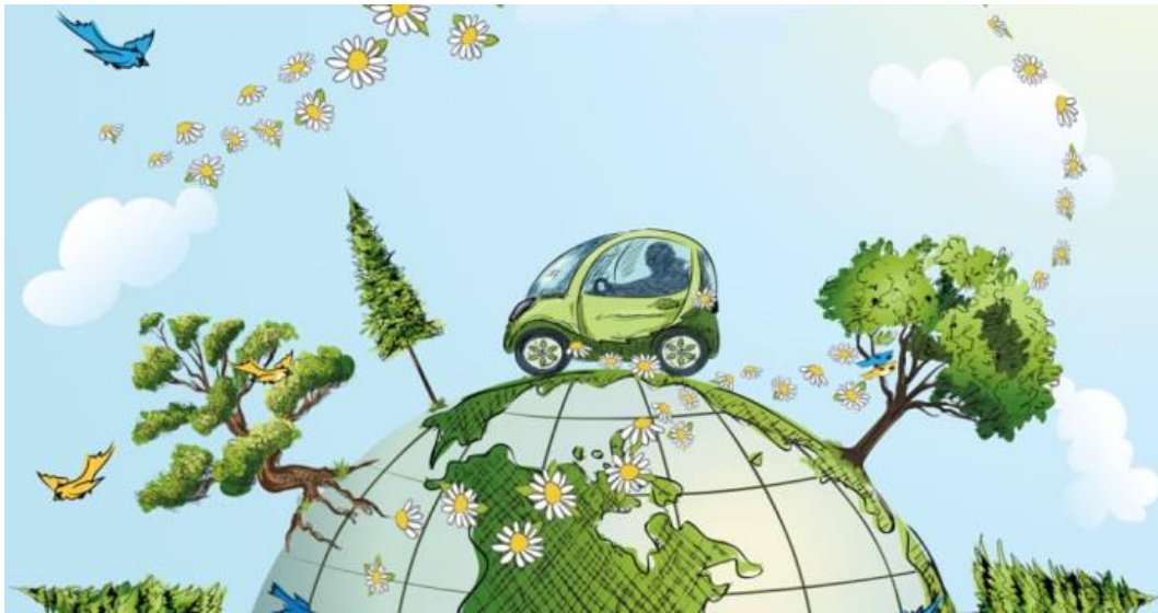
Gambar 2. Berbagai macam organisme di bumi

Ekologi merupakan salah satu ilmu dasar bagi lingkungan. Ekologi berarti penyelidikan tentang kehidupan organisme-organisme dalam jagat raya. Titik berat ekologi terletak pada proses saling keterkaitan antara organisme dengan lingkungan disekitarnya. Singkatnya, ekologi adalah sebuah kajian tentang organisme atau makhluk hidup pada umumnya: manusia, hewan, tumbuhan dan makhluk-makhluk hidup lainnya termasuk virus serta hubungan atau interaksi diantara makhluk hidup tersebut satu sama lain dan dengan ekosistem seluruhnya dalam sebuah proses kait mengait.