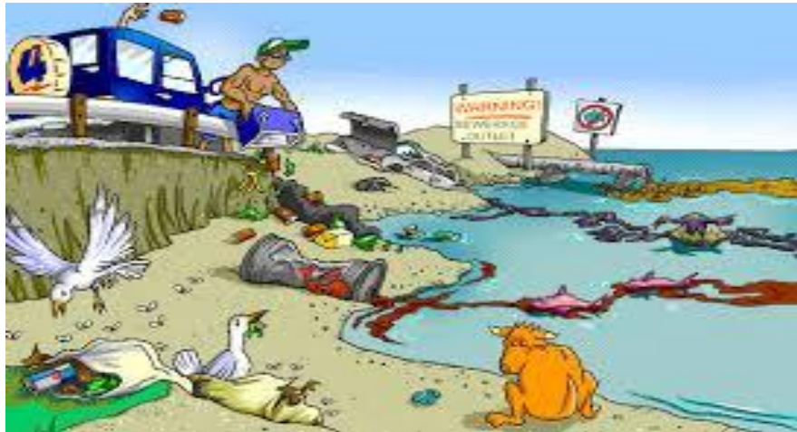
gambar 8. Pencemaran Lingkungan