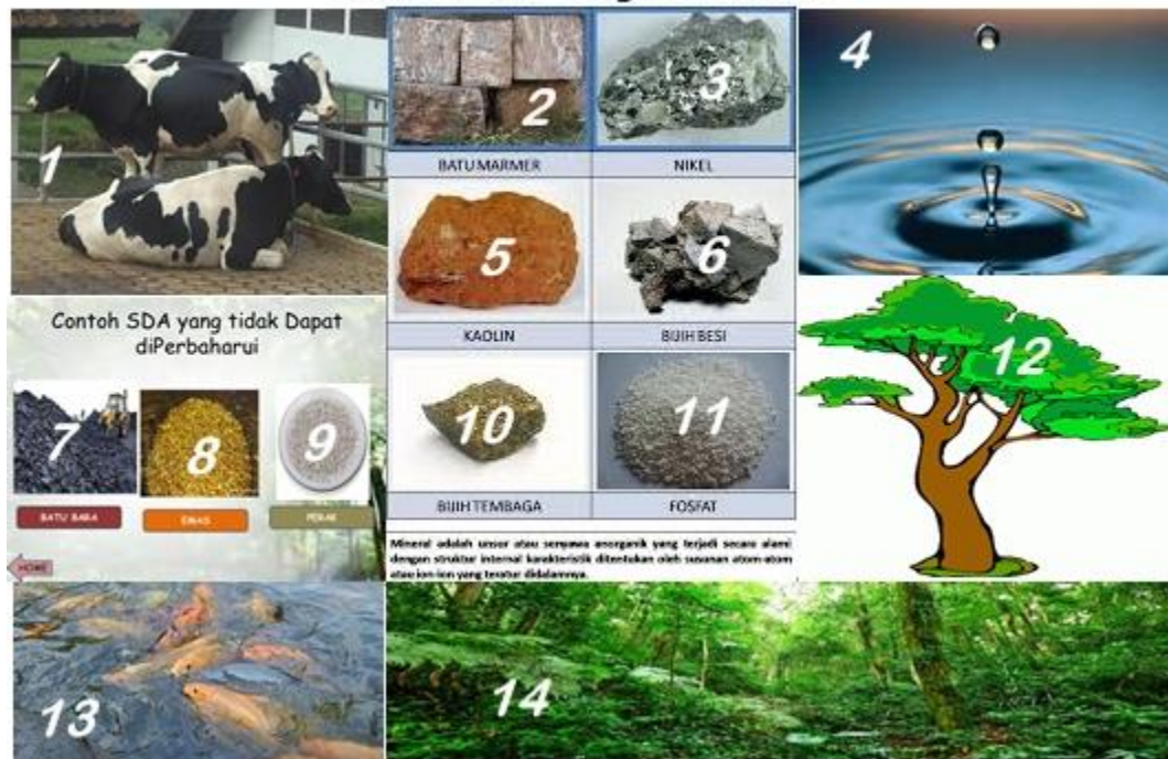
Gambar 6. Macam-macam sumber daya alam