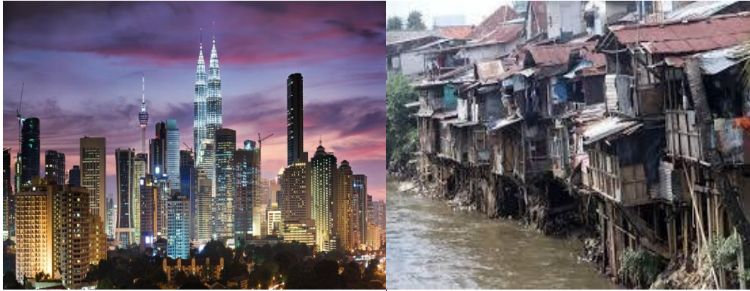
Gambar 4. Perbedaan Pembangunan