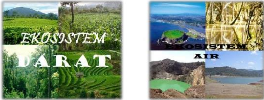
Gambar : 3. Ekosistem darat dan laut