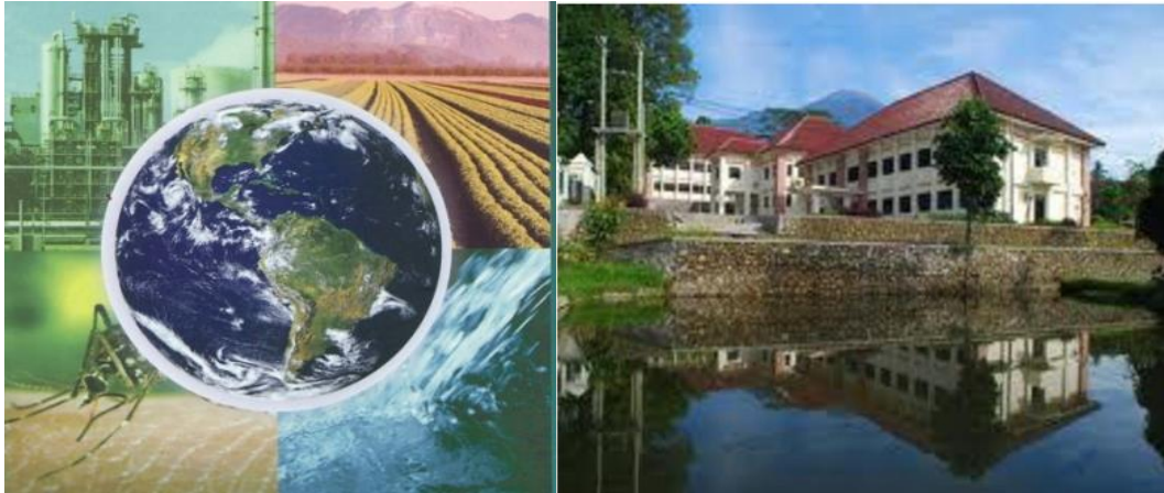
Gambar 7. Kesehatan lingkungan