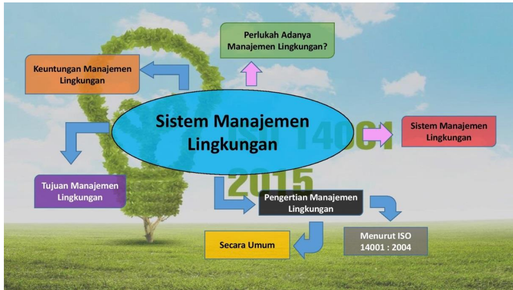
Gambar 9. Managemen Lingkungan