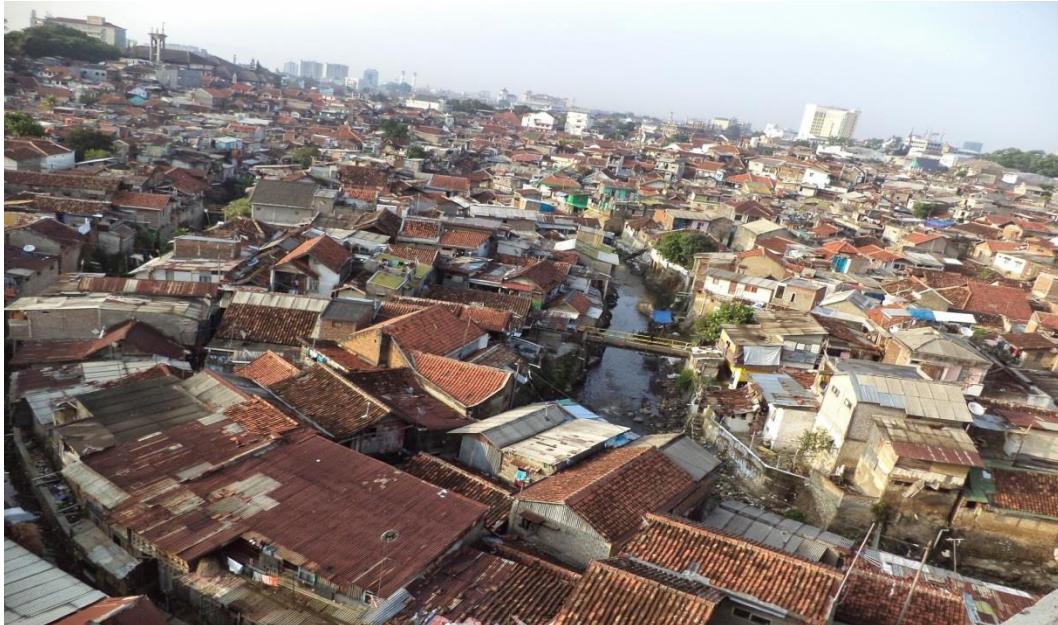
Gambar 5. Kepadatan penduduk dan perumahan