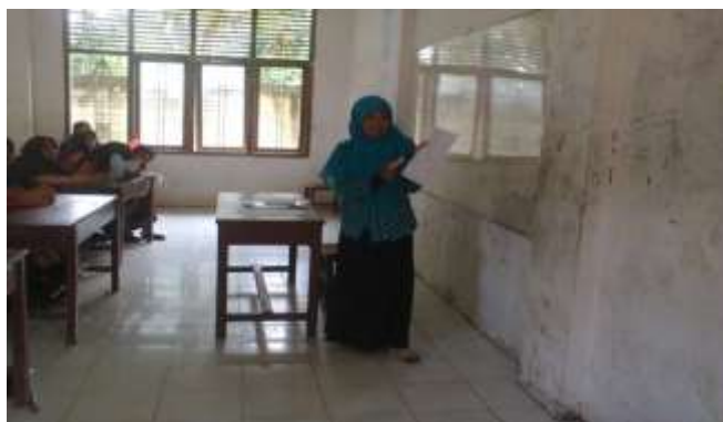
Guru menjelaskan cara menjawab soal pre-test dan post-test