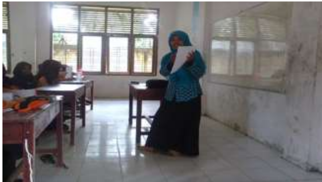
Guru menjelaskan cara menjawab LKS