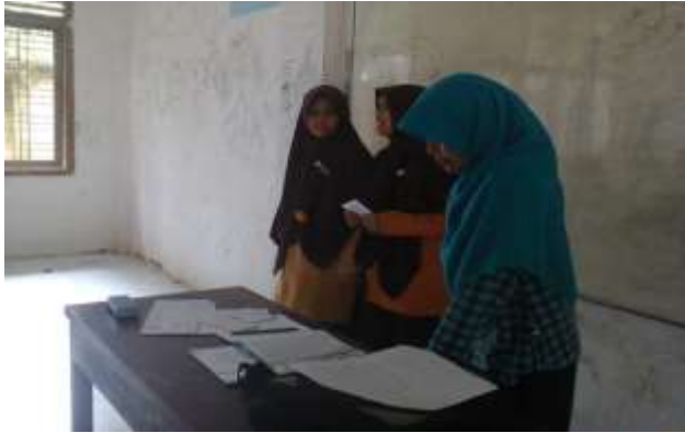
Kegiatan siswa belajar dengan permainan “mematuhi perintah”