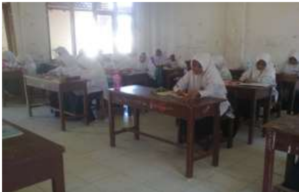
Kegiatan siswa mengerjakan soal post-test