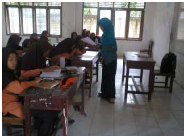
Guru membagikan lembar LKS kepada siswa