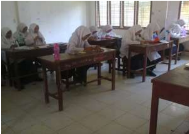
Kegiatan siswa mengerjakan pre-test