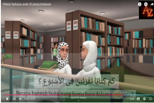
صورة ١,١ الفيوم الكرتوني بالعنوان "المكتبة"