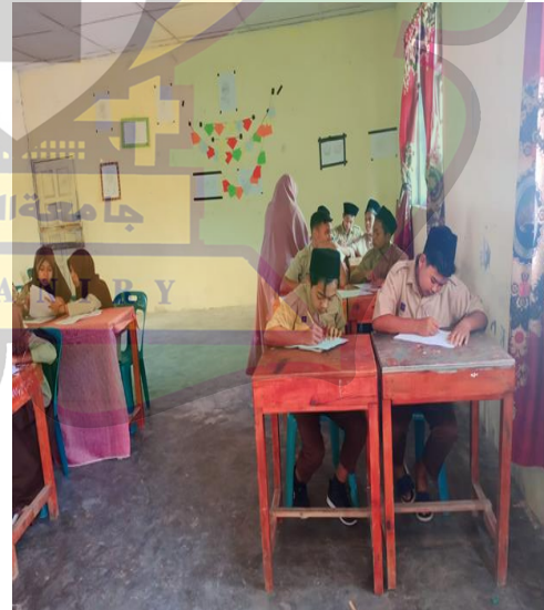
الصورة عند توزيع استبيانات دوافع الطلاب الصورة عند توزيع ورقة استبيانات الشخصية