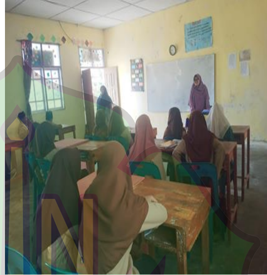
صورة الباحثة عند إرشاد الطلاب للإجابة على الاستبيان صورة الباحثة عندما تقابل معلمة اللغة العربي