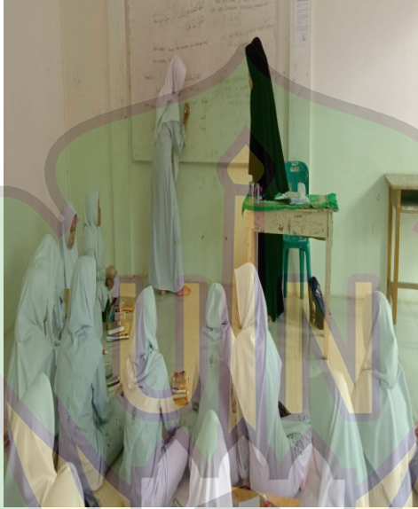
إجابة ورقة العمل