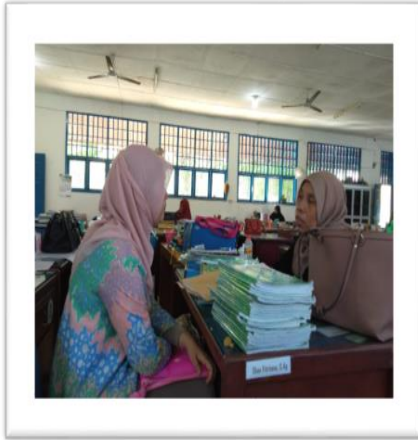
Gambar 1. Peneliti melakukan pengumpulan data di MAN 1 Aceh Barat