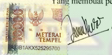
Cut Zehra Khalila