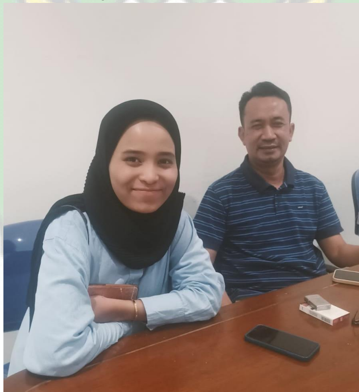
Foto dengan Teuku Banta Syahrizal Wakil Ketua DPW Partai Nasdem Aceh