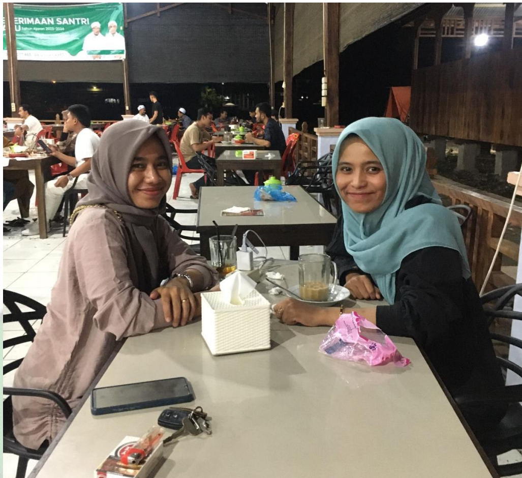
Foto dengan Irhamna utami Wakil Ketua DPW Partai Nasdem Aceh dan Bacaleg