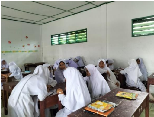
Foto 1.2 siswa berdiskusi dalam