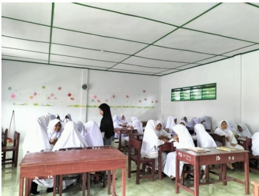
Foto 1.3 peneliti mengawasi siswa kelompok