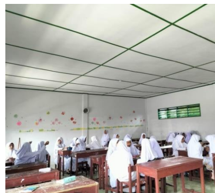
foto 1.4 siswa berdiskusi dalam