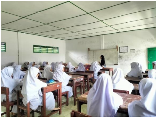
Foto 1.1 peneliti menjelaskan kepada siswa kelompok Tentang metode tutor sebaya