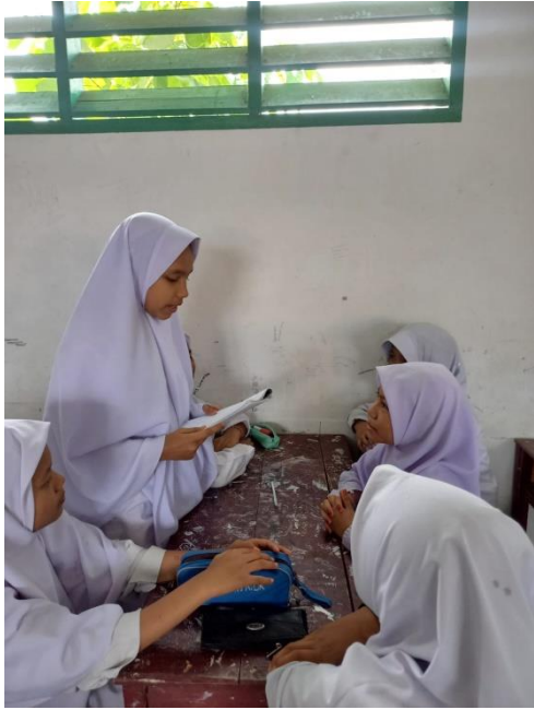
Foto 2.1 Tutor menyampaikan materi Kepada teman kelompoknya