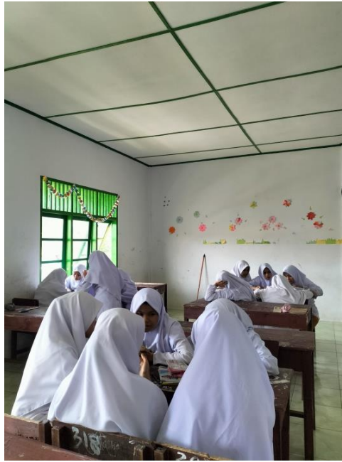
foto 2.2 siswa menulis hasil diskusi mereka