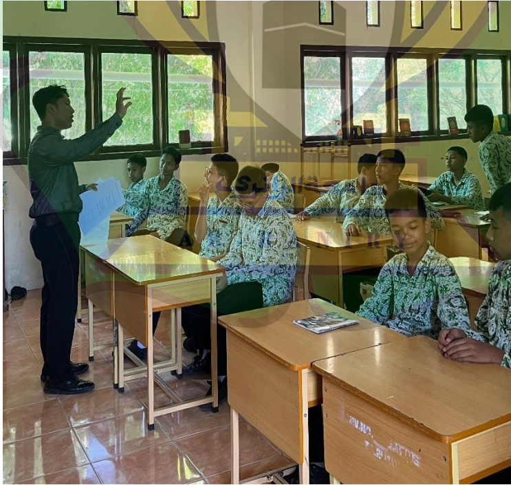
شرح الباحث على المادة