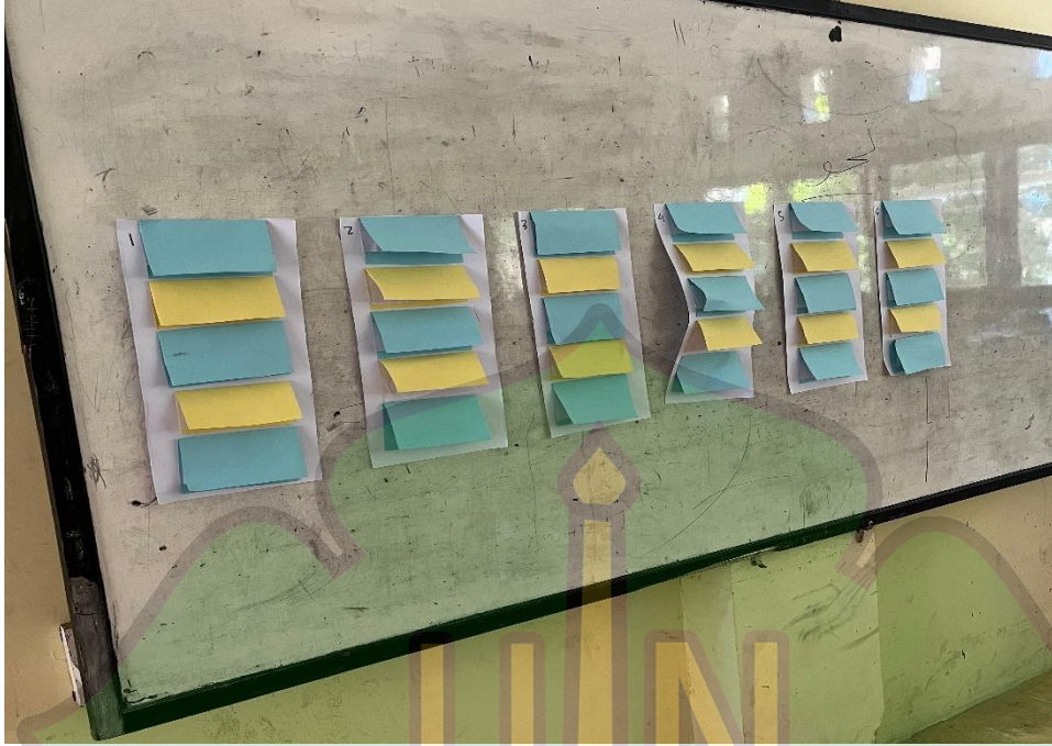
الأستلة في أسلوب TGT