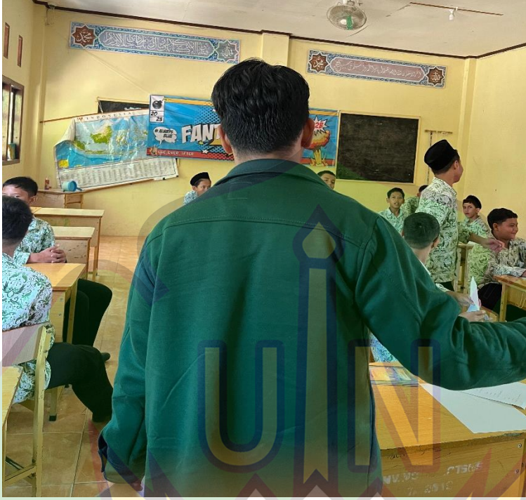
التعرف على الباحث والاختبار القبلي