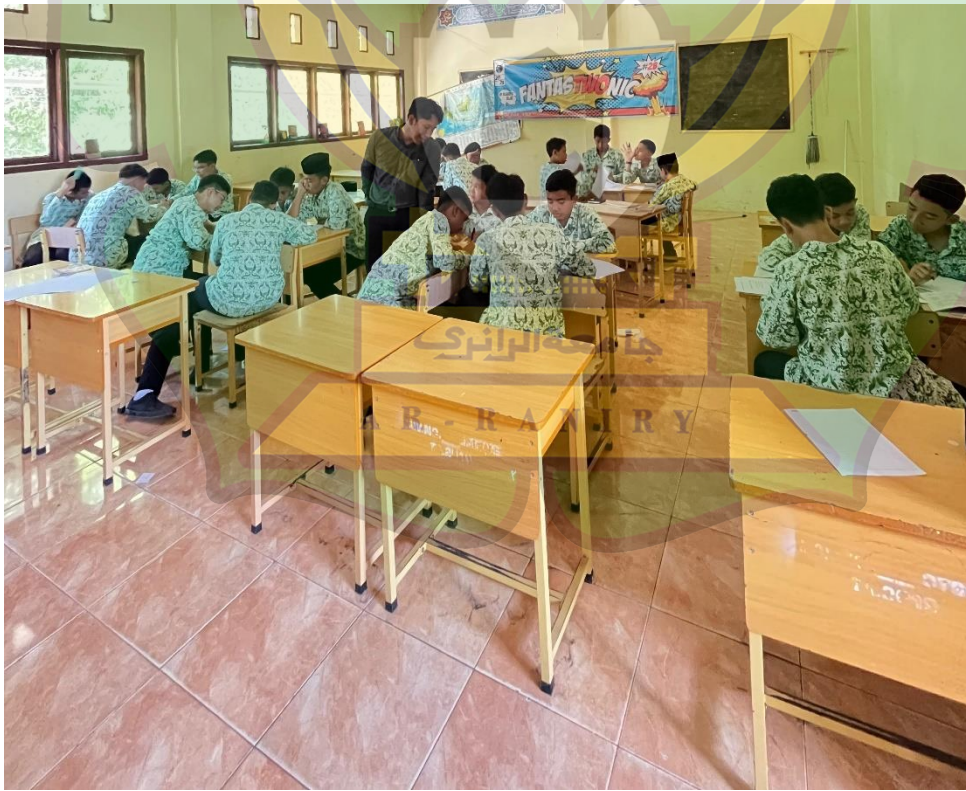
الاختبار البعدي والاستبانة