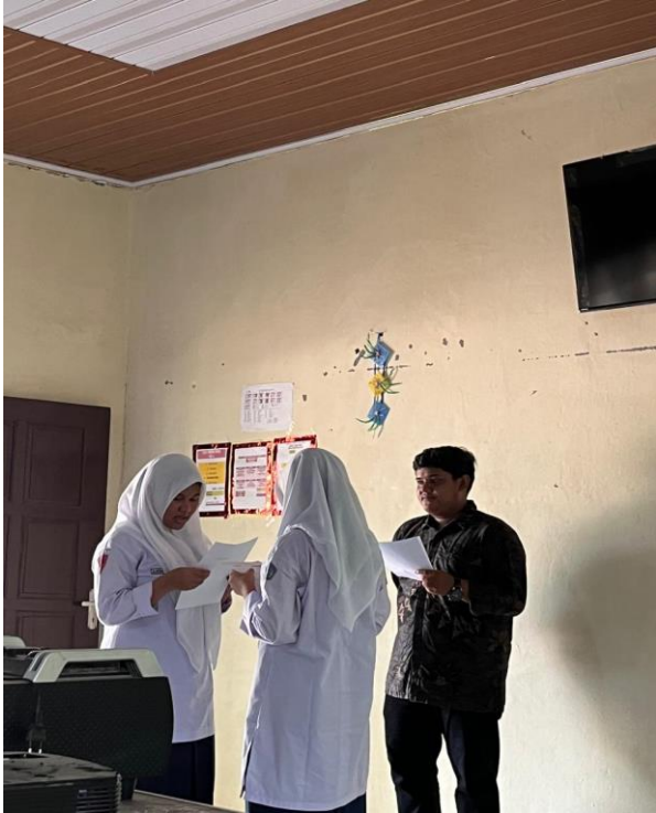
Praktek Muhadasah Siswi