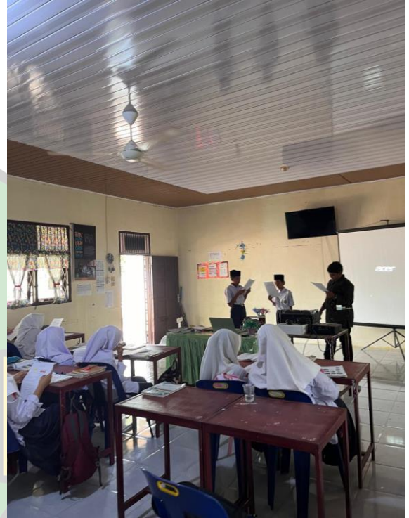
Praktek Muhadasah Siswa