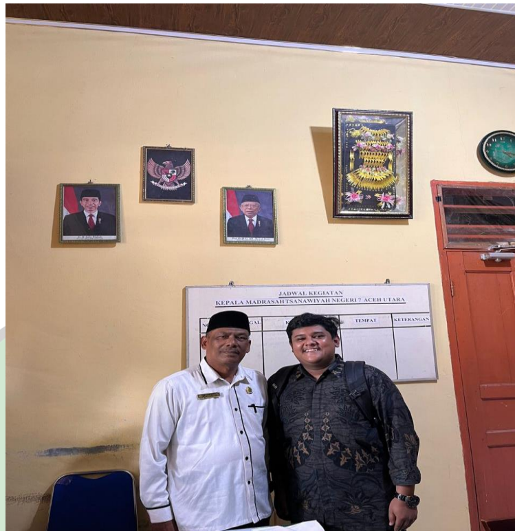
Praktek Muhadasah Siswa