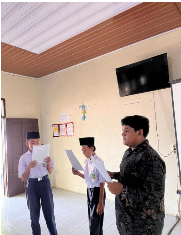
Praktek Muhadasah Siswa