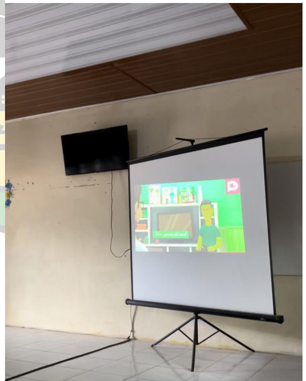
Penerapan Media Plotagon