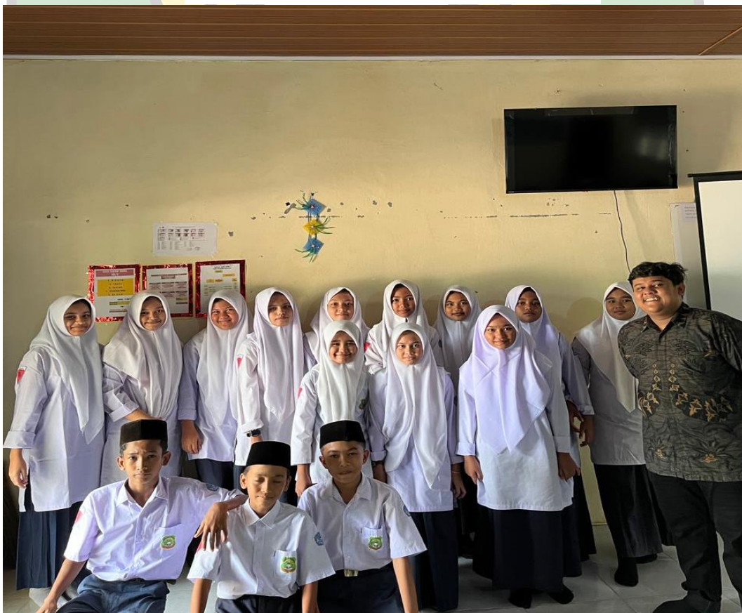
Foto Bersama Seluruh Siswa dan Siswi