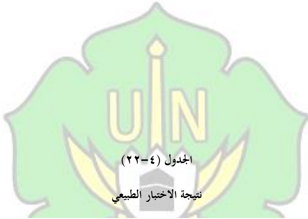
Tests of Normality

ب) إذا كان درجة مستوى الدلالة (Sig) > .05,0 . فالتوزيع البيانات لا توزيع العادي.