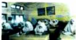
البحث في الصور الفوتوغرافية