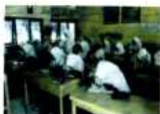
البحث في الصور الفوتوغرافية