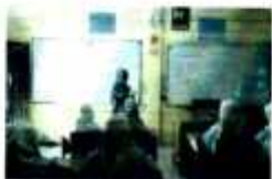
البحث في الصور الفوتوغرافية