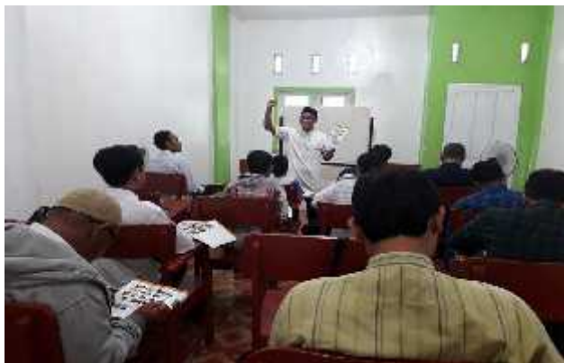
Proses Belajar Mengajar Kelas Ikhwan