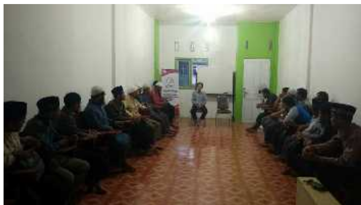
Bimbingan Pengajar Darul Lughah