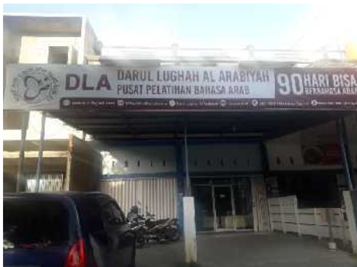
Halaman Depan Darul Lughah