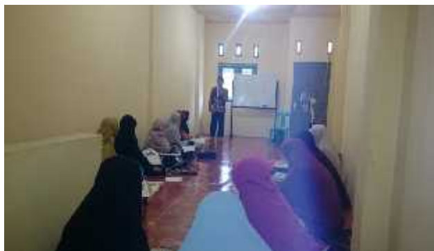
Proses Belajar Mengajar Kelas Akhwat