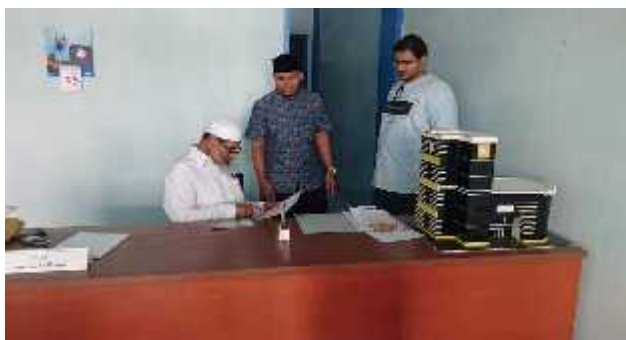
Kunjungan Pengarang Kitab Al-Arabiyyah Baina Yadaik