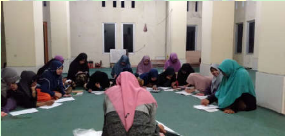
Santriwati Sedang Mengisi Post test