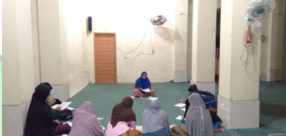
Santriwati Sedang Mengisi Pree test

Proses Pemberian Materi Kitab Dengan Penggunaan Metode Qawa'id wa tarjamah